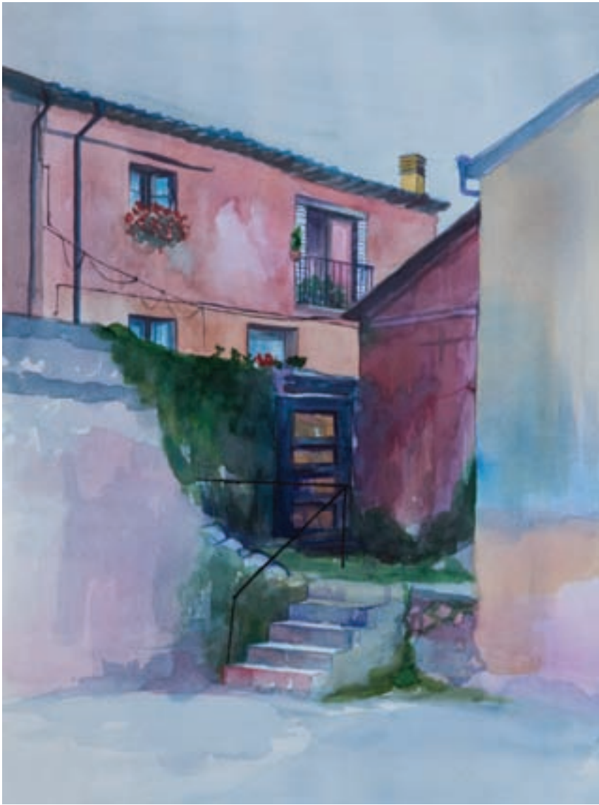
Rincón II Acuarela 48 x 36 cm